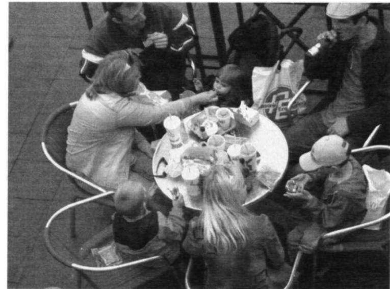
Самоидентификация «Мы одна семья!» материализуется в совместном застолье. Реплики каждого поедающего дары «Макдоналдса» сливаются в едином потребительском дискурсе семейного уровня. Но каждая фирма мечтает, чтобы потребители стали частью ее корпоративной семьи, с гордостью произнося: «Мы едим только в «Макдоналдсе». Москва, 2005.

(г) Индивидуальное потребление как коммуникация. Нельзя жить в обществе, не обмениваясь информацией с подобными себе людьми. Современный французский социальный теоретик Жан Бодрийяр делает акцент именно на этой сущности потребления (он абсолютизирует символическую сущность потребления, не замечая его более естественных основ: «Потребление, в той мере, в какой это слово вообще имеет смысл, есть деятельность систематического манипулирования знаками» [Бодрийяр 1999: 213]). Хочет индивид или не хочет, но он является текстом для окружающих его людей. Они его «читают», как читают книги и газеты. Читается его лицо, тело, одежда, обувь, прическа,