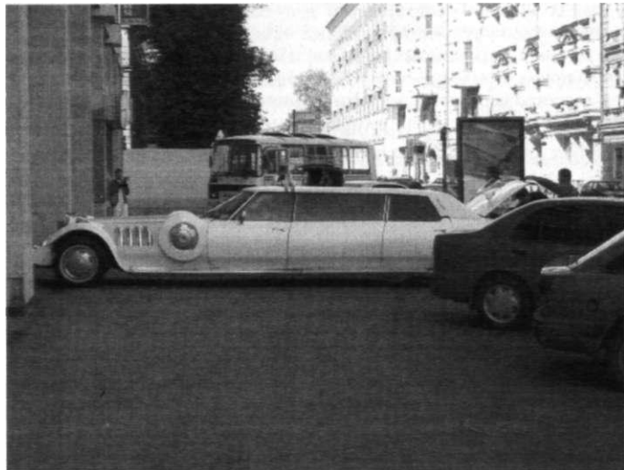
Свадьба - публичный праздник престижного потребления. Лимузин используется как традиционно популярный символ непрактичного статуса: ездить на нем неудобно, но зато никто не усомнится в значимости перевозимого статуса, о торжественных случаях. Москва, 2005.

С помощью оптических приборов резко увеличивается дальность зрения. Телевидение позволяет наблюдать то, что происходит за десятки тысяч километров. Системы радиосвязи обеспечивают возможность слышать голос собеседника, находящегося на другом конце планеты. Одежда и обувь резко увеличивают способность организма сопротивляться атмосферному воздействию. Отапливаемые жилища дают возможность автономно существовать в любых климатических условиях (это гиперкожа). Велосипеды, автомобили, поезда и самолеты резко